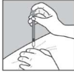
Şekil – 3

Yetişkinlerde önerilen doz 20 mg glatiramer asetatın (bir adet kullanıma hazır dolu enjektör) günde bir defa deri altına enjeksiyonudur.