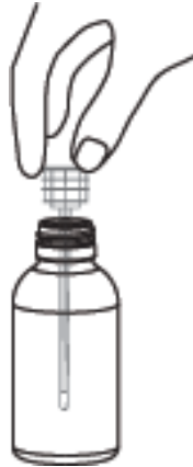
Önce enjektörün adaptörü şişeye oturtulur.