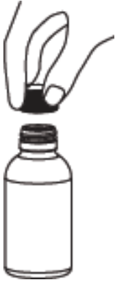
ABİZOL 1 mg/ml oral çözelti şişesinin kapağı açılır.